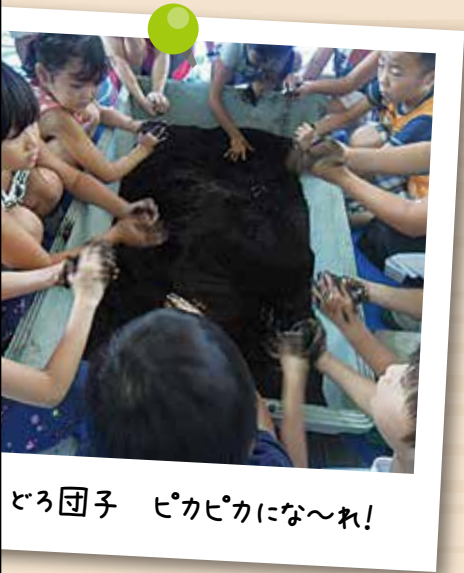
どろ団子 ピカピカにな〜れ!