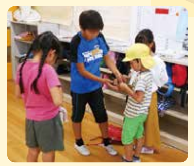
保育園児のすまいる体験