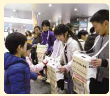
歳末助け合い募金活動