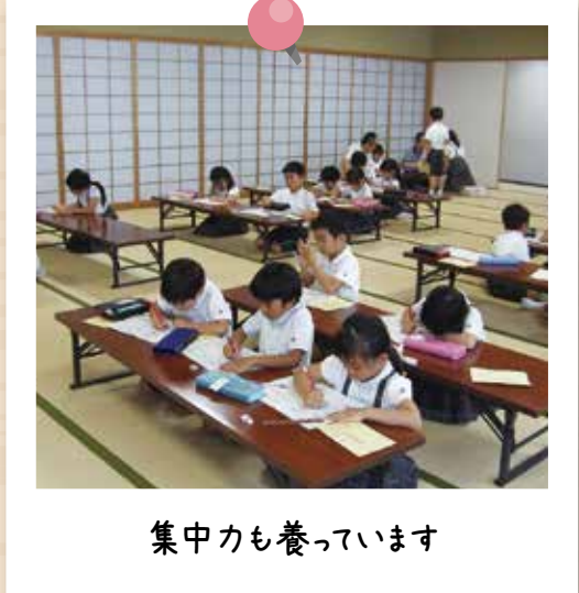
集中力も養っています