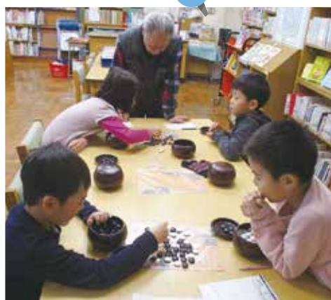
次の一手…真剣に対局中 ～囲碁教室～

これらの教室は、地域ボランティアやPTAなどの方々の協力により実施されています。