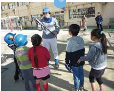
プロを目指そう! ～野球教室～