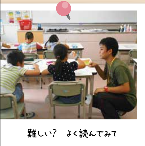
難しい? よく読んでみて

勉強会は子どもたちの基礎学力定着のため、週1回程度行っています。教員免許を持ったスタッフが、学年ごとに算数や国語の復習等を担当しています。