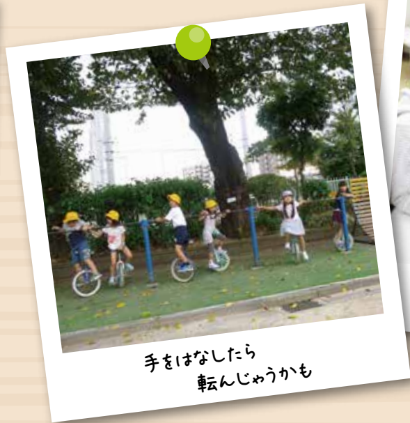
手をはなしたら 転んじゃうかも