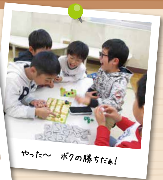
やった〜 ボクの勝ちだぁ!