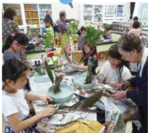
きれいにできるかな ～生け花教室～